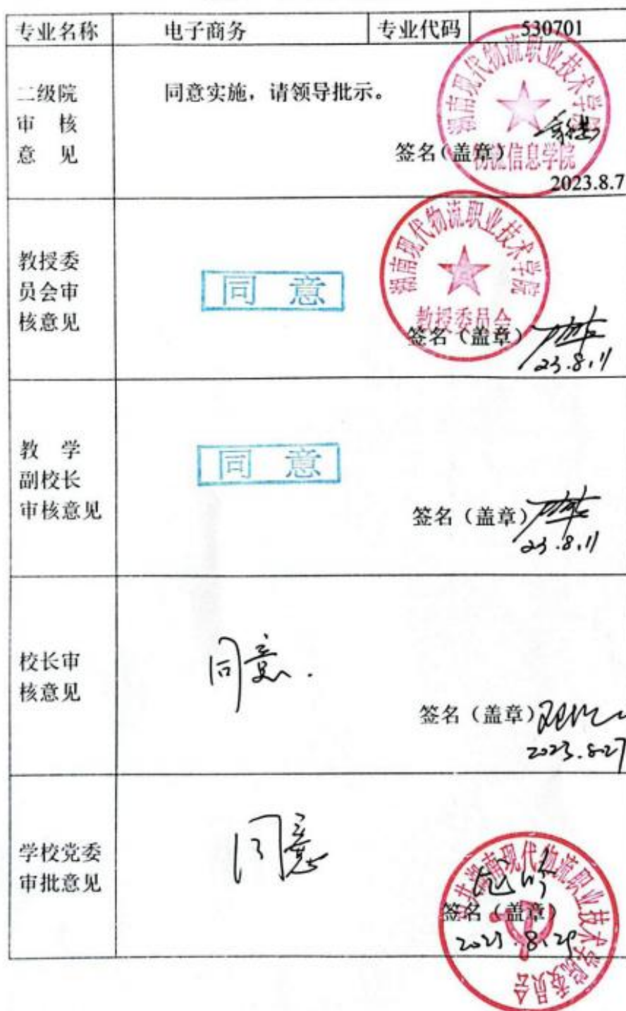
附表 7 专业人才培养方案审批表