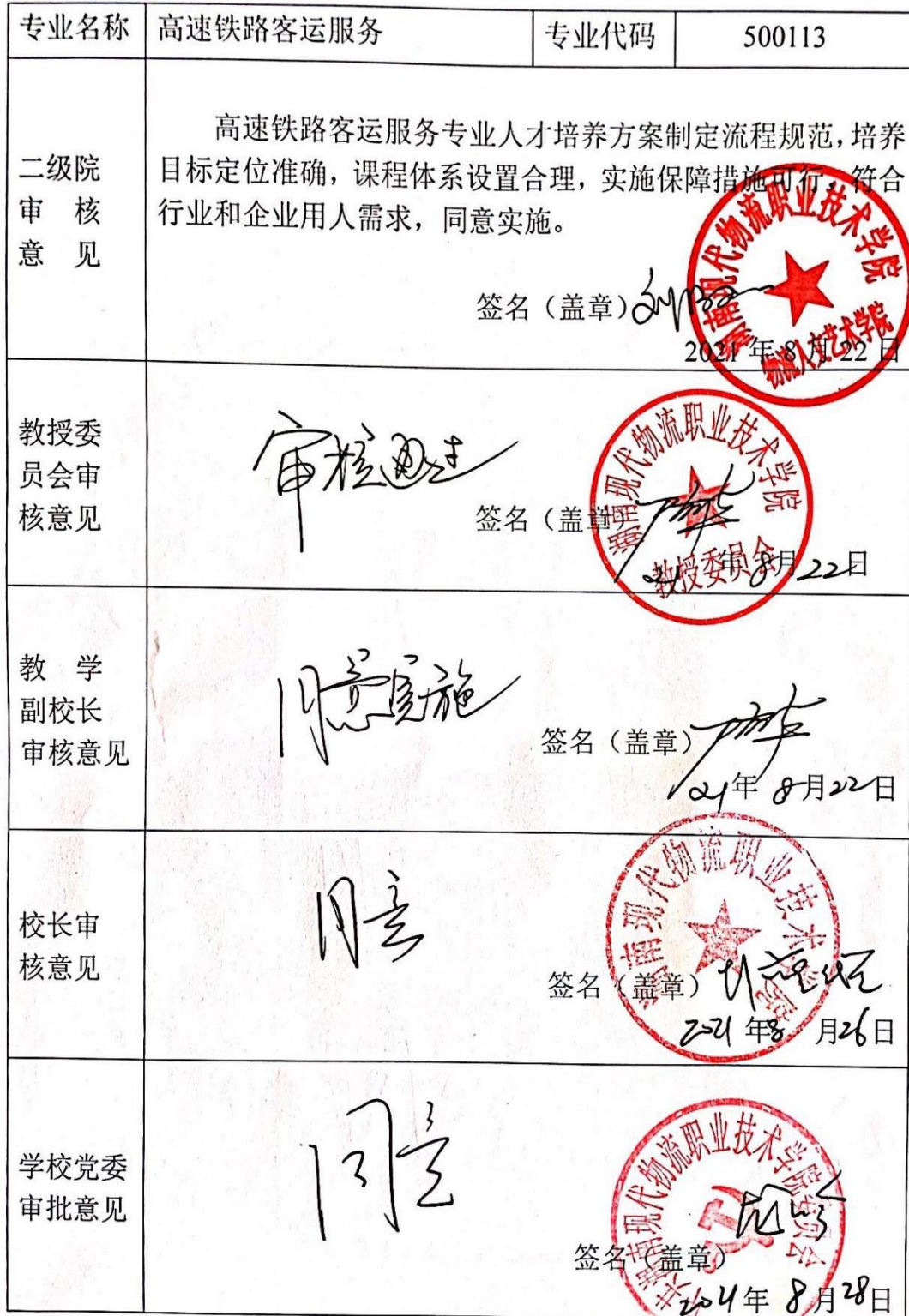
附表7 专业人才培养方案审批表