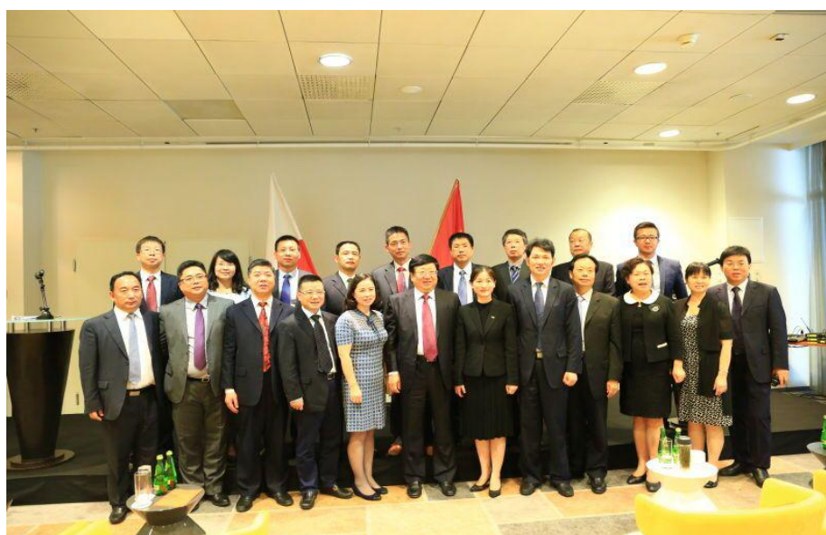
图五 湖南省政府代表团出访人员合影

此次随湖南省人民政府高端访问团出访欧洲的还有省国土资源厅、省国资委、省金融办等政府职能部门主要负责人和湖南省建筑和物流业界的知名企业（如远大住工、威胜电子、湖南环达公路桥梁建设总公司、湖南国湘人力资源劳务责任有限公司、长沙实泰物流有限公司）的高级管理人员。十天的欧洲三国商务考察彼此也结下了深厚友谊，下一步学院将与湖南本土这些知名企业探讨校企合作对接工作，以推进学院可持续发展。